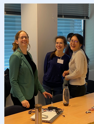
Nachwuchstagung 2022 in Poznań und Nachwuchstagung 2023 in Nijmegen

Die jährlich stattfindende Nachwuchskonferenz "Junge Forschung in DaFZ" bietet Promovierenden die Gelegenheit, sich über ihre Forschungsprojekte mit anderen jungen Wissenschaftler*innen auszutauschen , Herausforderungen gemeinsam zu reflektieren und sich international zu vernetzen. Im Rahmen der Tagungen finden zudem Doktorand*innen-Workshops mit hilfreichen Themenschwerpunkten zu den Dissertationsprojekten statt.