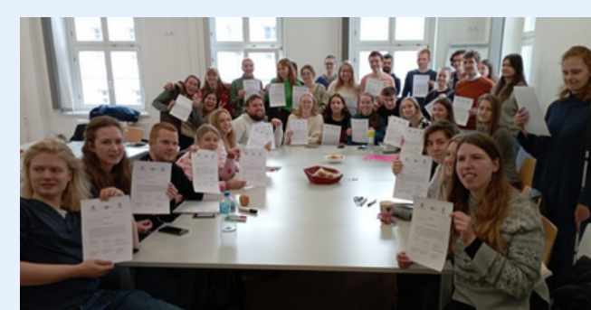
Projektseminar (WS 2022/23) "Kompetenzerwerb durch internationale Austausch- und Begegnungsprojekte" mit abschließender Studienreise und Projektwoche in Marburg