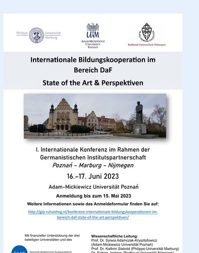
Internationale Konferenz 2023 Adam-Mickiewicz-Universität Poznań